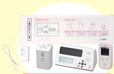
スタンダードシリーズ