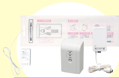
ナースコール連動シリーズ